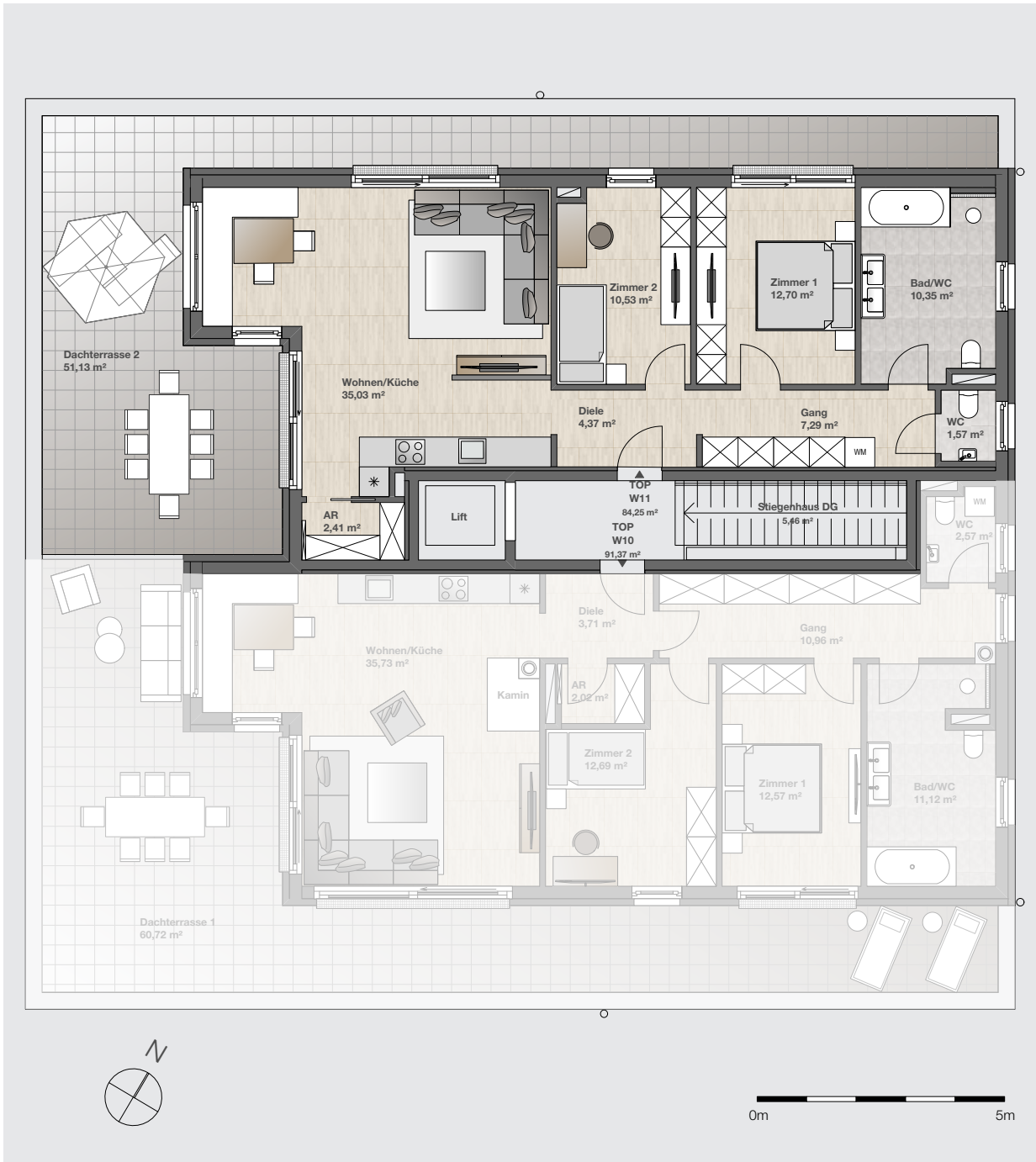
Position der Wohnung