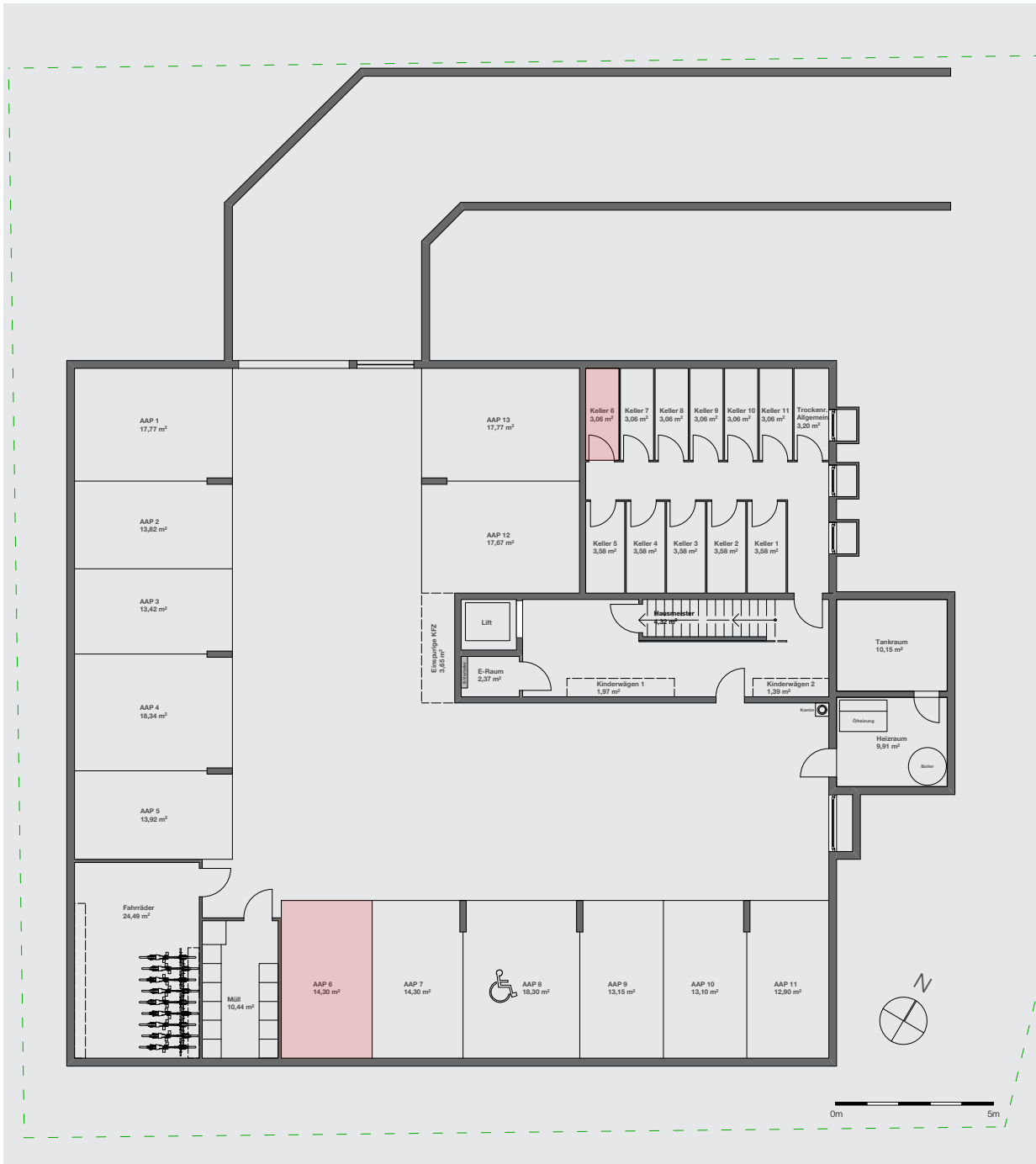
Autoabstellplatz und Keller im KG